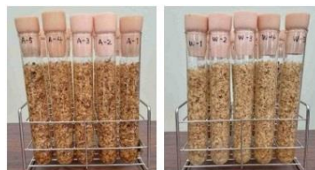
殺菌前の状況(左:A全木、W右剥皮済)