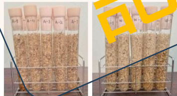
殺菌前の状況(左:A全木、W右剥皮済)